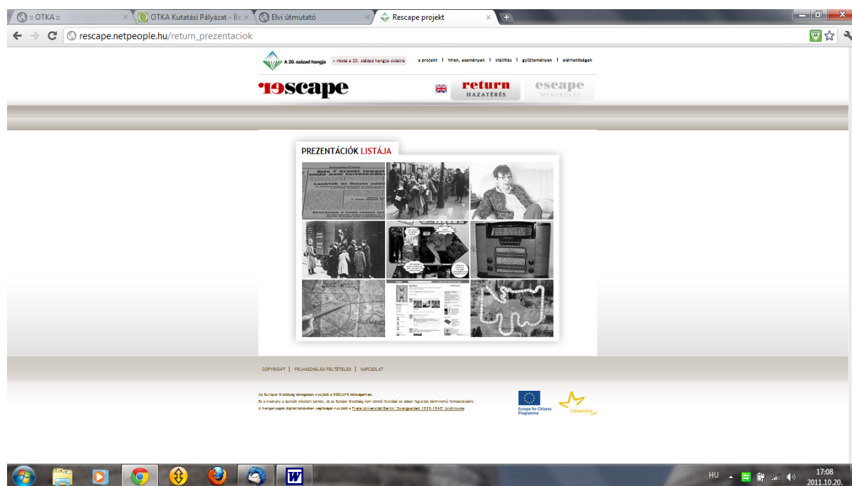
3. ábra: A RESCAPE projekt nyitóoldala

Az elnyert EACEA támogatásból megvalósult RESCAPE című projekt során ( http://eacea.ec.europa.eu/citizenship/funding/2010/selection/docs/citizen_acton4_selection_2010.pdf , 511971) azt a két interjú gyűjteményt dolgozzuk fel, melyet a pilot projekt segítségével digitalizáltunk és archiváltunk (a Munkaszolgálat 1939-1945 és az ESCAPE gyűjteményt). A gyűjtemények feldolgozásában egyetemi kurzus keretében diákok is részt vettek (ELTE, PTE). Partnerszervezetként közreműködött az ELTE Társadalomtudományi Szakkollégium, a HAVER Alapítvány és a Történelem Tanárok Egylete. A feldolgozott gyűjteményekből középiskolai oktató-csomagot készítettünk, melyet a projekt keretében a partnerek és a diákok részvételével középiskolákban is bemutattunk. A gyűjtemények széleskörű kutathatóságát és oktatásban való felhasználást a projektből készült DVD és az interaktív internetes oldal is segíti. (Vö.: http://www.20szazadhangja.hu/rescape )