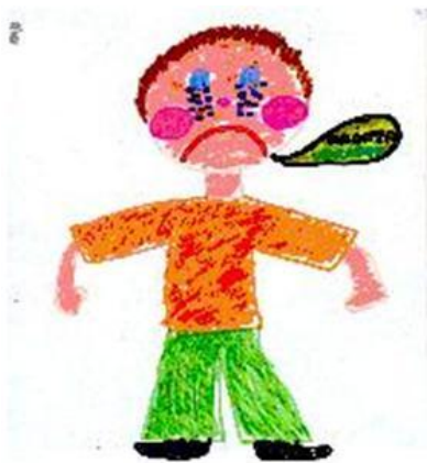
1. rajz: Vesztés. Csak a vesztes jelenik meg a rajzon „Fránya verseny!” (8 éves lány)

A versengéssel és a győzelemmel kapcsolatban a gyerekek többsége (72% és 80%) mind a potenciális (versengés) mind a tényleges győztest és vesztest megjelenítette a rajzán (győzelem). A vesztéssel kapcsolatban a lányokra jellemzőbb, hogy nem ábrázolják a győztest és a vesztest együtt, hanem csak a vesztest (23%) rajzolják le, vagyis „izolálják” a vesztest a szociális környezetétől. Ezekben a rajzokon a vesztes gyakran egyedül van és sír. (1.. rajz) A lányok vesztés rajzainak majdnem egyharmada (32%) nem tartja egyben a győztes és vesztes felet, szemben a fiúk rajzainak csak 13% -ával (Fisher-egzakt próba p = .78 , tendenciaszinten szignifikáns).