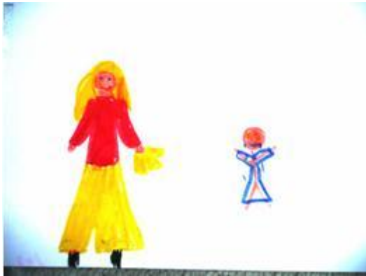
4. rajz. Vesztes. 8 éves lány.

különbséget (Khi-négyzet = 1,316, p = ,251 , n.s.) viszont mind a győzelem mind vesztés esetén szignifikánsan nagyobb valószínűséggel rajzolták a gyerekek a győztest nagyobbak, mint a vesztest (Győzelem: Khi-négyzet = 20,455, p < ,0001 ; Vesztes: Khi-négyzet = 18,778, p < ,0001 ).