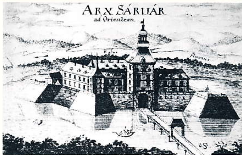
Matthias Greischer: Sárvár vára, 1680-as évek, rézmetszet, Magyar Nemzeti Múzeum, Történelmi Képcsarnok

Nádasdy Ferenc a gyűjteményében lévő műtárgyakra, képzőművészeti alkotásokra elsősorban mint egy tudatosan épített reprezentáció „kellékére” tekintett. A legkorszerűbb nyugati minták alapján felépített gyűjteményi egységekkel vallott saját törekvéseiről. Kincstárának tárgyai, asztalának díszül szolgáló edényei között a korszak legdivatosabb típusait találjuk; az országbíró luxusfogyasztásában a birodalmi arisztokráciához mérte magát. De ugyanezeket a mintákat követte Nádasdy Ferenc kincsei rendszerezésében, bemutatásában is. Sárváron a palotaépületen kívül, de a kerítőfalakon belül álló hosszú-