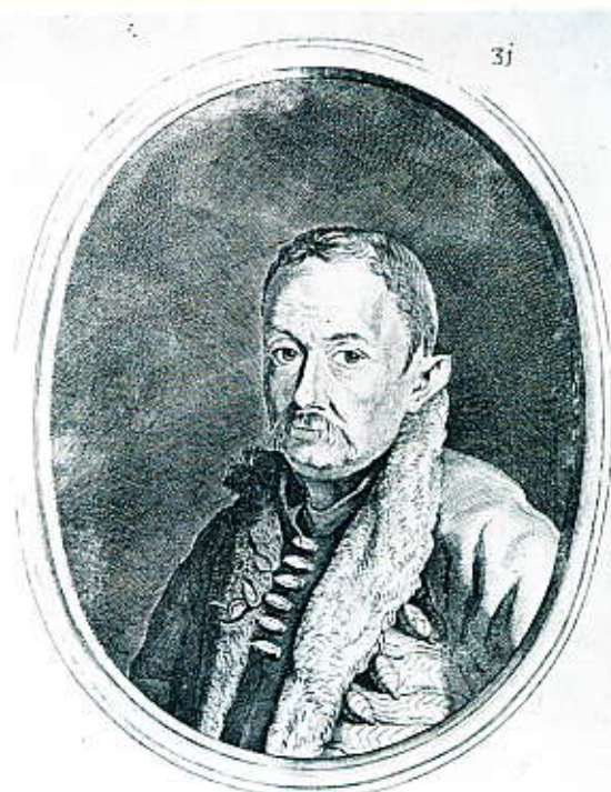
FRANCESCO NADASTI CONTE PERPETVO DELLA TERRA DI FOGARAZ, DELLI CONTADI DI CASTEL FERRATO, SINEG, E SALAD, SUPREMO CONTE & CONSIGLIERO DI STATO DI S. M. CES. E SUO CAMARIERO SUPREMO GIUDICE DELLA REALCORTE DI VNGHERIA.

vásárolta meg, ennek következtében az alsó-ausztriai nemesek közé is felvették. Kisebb birtokokon (Belatinc, Alsólendva, Lenti) túl