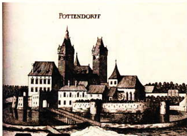
Pottendorf kastélya Georg Matthäus Vischer Topographia Archiducatus Austriae Inferioris Modernae című művéből, Bécs, 1672

A kutatásról bővebben a www.barokkudvar.hu honlapon lehet tájékozódni. Az eredményeket tartalmazó forrás- és tanulmánykötetek megjelenése 2013-ban várható.