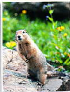
Címlapon: Sarki ürge (Tószegi Zsuzsanna felvétele Az Északi-sark kapujában című cikkünkhöz)